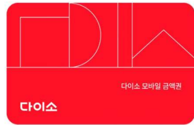
다이소 모바일상품권 (5,000원)