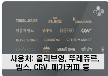
CJ 모바일상품권 (5,000원)