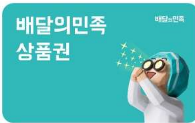
배민 모바일상품권 (5,000원)